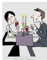
Au pied de Barrique

Avis de Diego_0985 - ★★★★★ | Le 21 Septembre 2010 à 10h06 Excellentissime. Aussi bien niveau breuvage que dans l'assiette. Il me tarde d'y retourner maintenant que la cuisine se fait vraiment sur place (bien qu'avant avec les merveilleux plats du Repère de Cartouche réchauffés sur place nous étions fort bien lotis!).