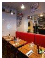
Non Solo Cucina